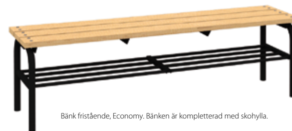
Bänk fristående, Economy. Bänken är kompletterad med skohylla.

Ståldetaljer pulverlackerade i valfri standardfärg (se separat färgkarta). Sitsen består av hel laminatskiva och består av valfri laminat enligt vår standard (se separat färgkarta). Bänken kan kompletteras med skohylla. Mot tillägg erbjuder vi även speciallösningar helt efter dina önskemål där du kan få stommen i den kulör du önskar enligt färgskala RAL och sitsen i valfri laminat.