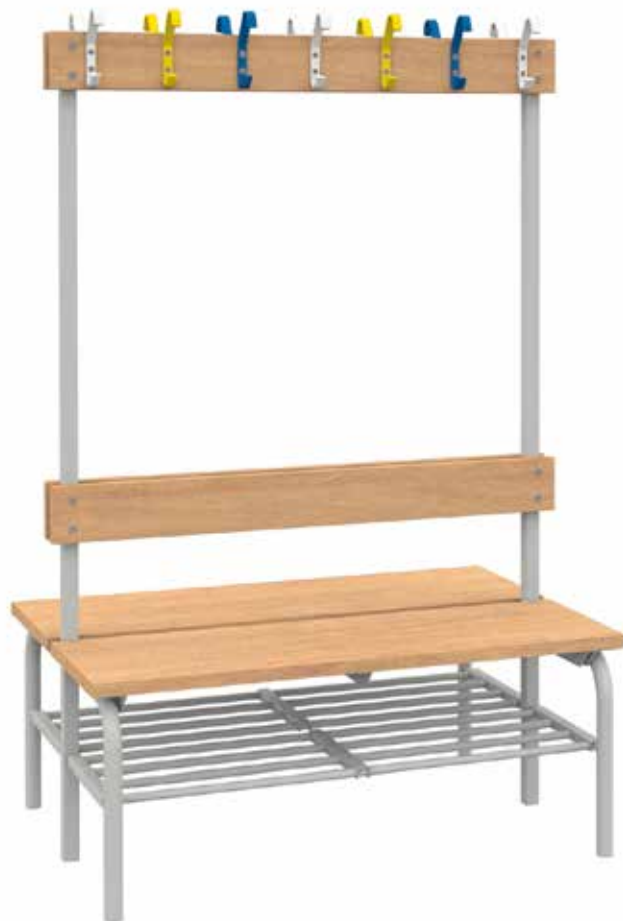
Omklädningsbänk dubbelsidig, Vision. Stativ i färg RAL 7035. Sits, rygglist och kroklist i eklaminat. Skolkrokar i färgerna RAL 9003, RAL 1017 och RAL 5012. Omklädningsbänken är kompletterad med skohylla.