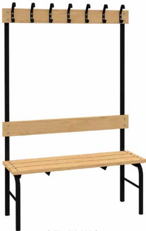
Omklädningsbänk enkelsidig, Economy.