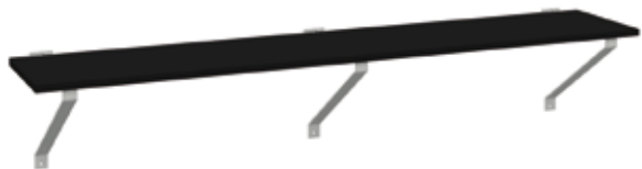
Bänk vägghängd, Vision. Konsolernas färg RAL 7035. Laminat i Diamond Black L-10.

Ståldetaljer pulverlackerade i valfri standardfärg (se separat färgkarta). Sitsen består av hel laminatskiva och kan väljas i valfri laminat enligt vår standard (se separat färgkarta). Mot tillägg erbjuder vi även speciallösningar helt efter dina önskemål där du kan få stommen i den kulör du önskar enligt färgskala RAL och sitsen i valfri laminat.