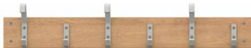
Kroklist 103, Vision. List i ekaminat. Krokar i färg RAL 7035.

Växelvis väskkrokar och skolkrokar pulverlackerade i valfri standardfärg. List av massiv furu eller valfri laminat enligt vår standard (se separat färgkarta).