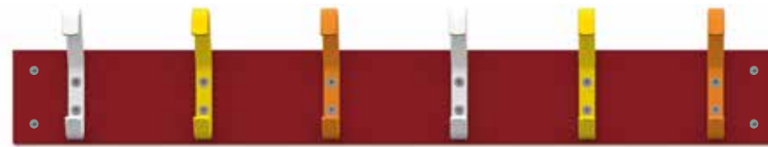
Kroklist 102, Vision. List i laminat i färg RAL 3001. Krokar i färgerna RAL 9003, RAL 1017 och RAL 2000.

Skolkrokar pulverlackerade i valfri standardfärg. List av massiv furu eller valfri laminat enligt vår standard (se separat färgkarta).